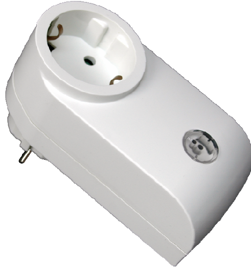
Figure 1 : Présentation du ZPLUG

Le ZPLUG se présente sous la forme suivante :